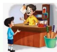
(صحبت با مغازه دار)